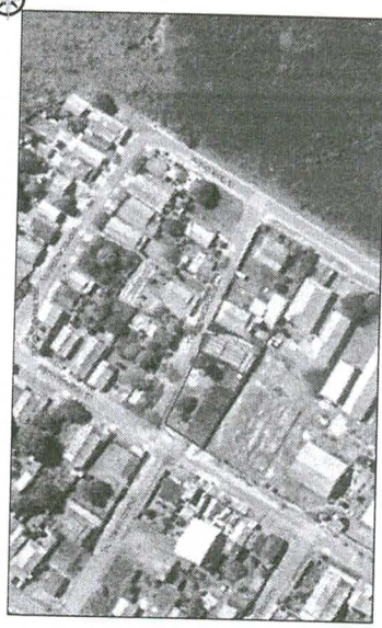
PLANTA DE SITUAÇÃO ESCALA 1:1000